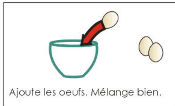
Ajoute les oeufs. Mélange bien.